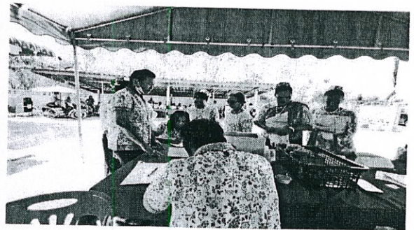
ลงทะเบียน